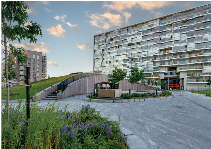
Zielony dach największego centrum handlowego w Skandynawii służy również jako zewnętrzna przestrzeń rekreacyjna dla budynków mieszkalnych.

Projektowanie i budowa zielonych dachów wymaga znajomości zagadnień z zakresu inżynierii budowlanej, gospodarki wodnej oraz pielęgnacji i uprawy roślin. Ważnym powodem technicznym rosnącej popularności zielonych dachów są ich