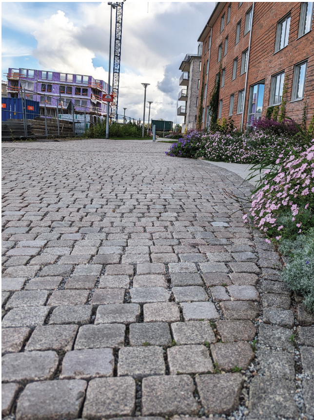
Keramzyt z odzysku po rozbiórce wykorzystany do kompensacji obciążenia pod ścieżką pieszo-rowerową.

Leca Infra Eco składa się w 100% z odzyskanego keramzytu. Materiał ma bardzo niski ślad węglowy na co wskazuje deklaracja EPD. Materiał po odzyskaniu z poprzedniego wypełnienia jest badany pod kątem parametrów technicznych. Klient ma pewność, że proponowany materiał nie utracił swoich właściwości w okresie poprzedniego użytkowania. Ponadto dla materiału przygotowana jest nowa deklaracja własności użytkowych (DoP), która jest wymagana dla materiałów budowlanych.