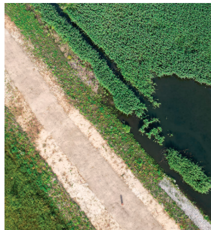
Gudenåen to rzeka położona we wschodniej Jutlandii, która ze swoimi 149 kilometrami jest najdłuższą rzeką Danii

Aby poradzić sobie z ekstremalnymi opadami deszczu i zapewnić ochronę obszarów położonych na wysokości bliskiej poziomowi morza, budowany jest kanał wodny między rzeką Storkeengen a rzeką God. Aby zapobiec potencjalnemu problemowi wypiętrzenia gruntu na mokrej łące i osunięcia nasypu, w rdzeniu grobli użyto dużych ilości keramzytu Leca. Uprościło to i ułatwiło budowę, zapewniając jednocześnie szybkie i bezpieczne wykonanie prac.