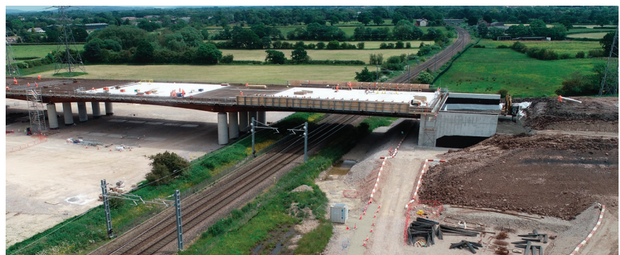
Projekt realizowano przy czynnym torze kolejowym

Rozważano wiele materiałów spełniających wymagania zasypki pomiędzy konstrukcją w tym również zwykłego kruszywa. Leca® KERAMZYT i jego właściwości pozwoliły na realizację fundamentowania w tych trudnych warunkach gruntowych. Rosey Thurling (starszy inżynier) w Costain wyjaśnia, że „Istnieje alternatywny produkt dostępny na rynku, jednak niewielki stopień zagęszczone