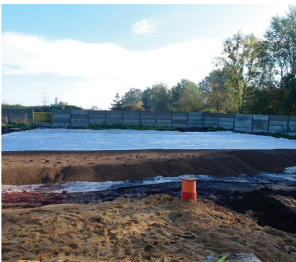
Wypienienie pod parkingiem

Analiza dostępnych danych archiwalnych wskazywała, że na obszarze planowanej inwestycji występują warunki geologiczno-inżynierskie utrudniające budownictwo. Podstawowym utrudnieniem będzie zaleganie słabonośnych gruntów organicznych oraz pokrywających nasypów o naruszonej strukturze oraz płytkie występowanie wód gruntowych, z możliwością zawartości agresywnego CO 2 . Przeprowadzone badania geologiczne potwierdziły występowanie gruntów bagiennych, tj. słabonośnych namułów, które charakteryzują się dużą ściśliwością i małym oporem na ścinanie. Tworzą one ciągłą warstwę, zalegając do głębokości 11,2 m. Stwierdzono również występowanie nasypów o grubości od 1 m do blisko 1,5 m, w większości o mało korzystnych właściwościach, głównie przez stosunek gruzu i odpadów bytowych do mas ziemnych.