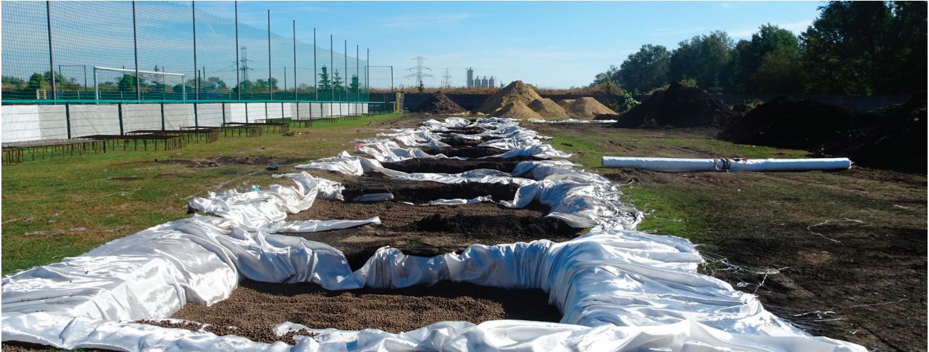
Odciążenie podłoża pod stopami fundamentowymi